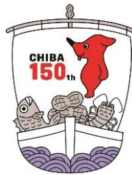
千葉県マスコットキャラクター チーバくん