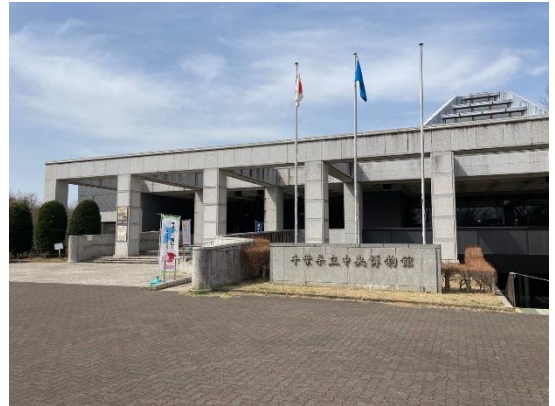
千葉県立中央博物館 外観