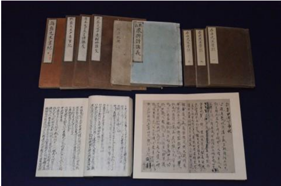
『答鯨吾君問目』（とうげいごくんもんもく） 安永9(1780)年写