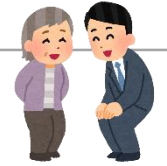
内閣府、『ほっと安心手帳』より