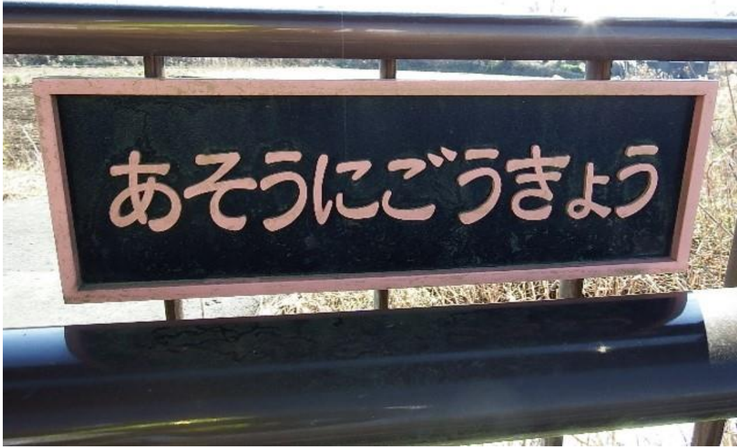
発生箇所 阿宗2号橋 (盗難発生後)