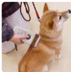
リーダーによる数字の読取

飼い主の元に帰りたくても帰れない、不幸なペットを無くすためにも、マイクロチップ装着によるペットの身元証明を行いましょう。