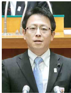
公明党 よこやま ひであき 横山 秀明 議員 (八千代市)