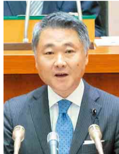
立憲民主党 鈴木 均 議員 (習志野市)