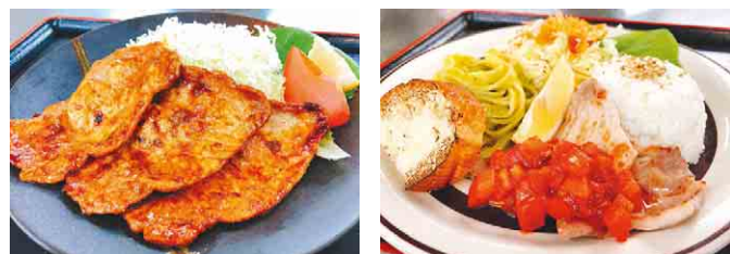
県産食材を使用した多彩なメニュー

店名 千葉県議会食堂 おいしい わらく 場所 千葉県議会棟 地下1階 営業時間 11:00~15:00(開庁日は原則営業) 問 043-223-0557