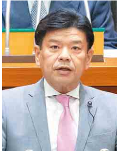
公明党 たむら こうさく 田村 耕作 議員 (千葉市花見川区)