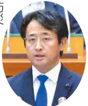
公明党 仲村 秀明 議員 (船橋市)