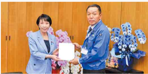
阿井議長から高市総務大臣に意見書を提出

台風15号および19号により、亡くなられた方々のご冥福をお祈り申し上げますとともに、被災された皆さまに心からお見舞い申し上げます。本県においても、記録的な暴風雨により広い地域で住宅被害や停電、断水などに見舞われ、農林水産業にも甚大な被害が発生しています。