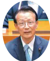
平和党 西尾 憲一 議員 (船橋市)