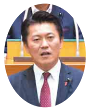
自民党 林 幹人 議員 (成田市)