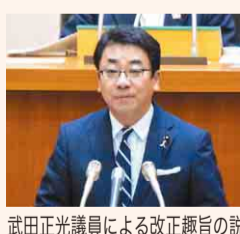
武正光議員による改正趣旨の説明

9月定例県議会において、議員提案による「千葉県子どもを虐待から守る条例の一部を改正する条例」が全会一致で可決されました(令和元年10月18日施行)。