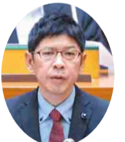
自民党 岩井 泰憲 議員 (印西市・印旛郡栄町)