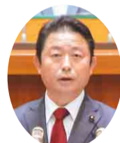
自民党 高橋 秀典 議員 (旭市)