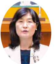
千葉民 入江 晶子 議員 (佐倉市・印旛郡酒々井町)