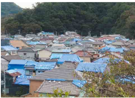
被災した地域の様子

問 被害額も極めて大きい今回の台風15号に、あらゆる支援の要請を国に対して行うべきと考えるがどうか。