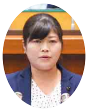
自民党 宮坂 奈緒 議員 (浦安市)