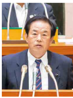
立憲民 河野 俊紀 議員 (千葉市美浜区)