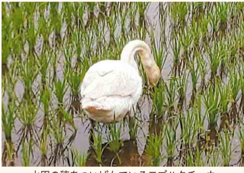
水田の穂をついばんでいるコブハクチョウ