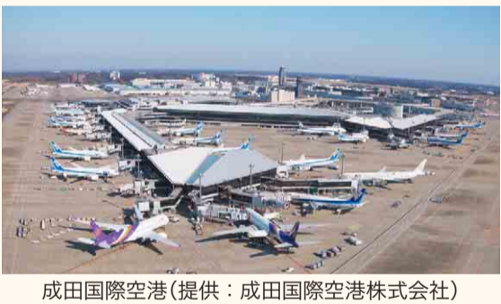
成田国際空港

県としても、長期的なビジョンに立って、明確な目標を掲げしっかりと取り組んでほしい。