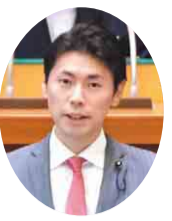
自民党 川名 康介 議員 (鴨川市・南房総市・安房郡)