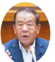
自民党 伊藤 和男 議員 (香取市・香取郡神崎町・香取郡多古町)