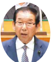
自民党 石井 一美 議員 (鎌ヶ谷市)