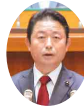
自民党 高橋 秀典 議員 (旭市)