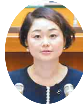
立憲民 安藤 じゅん子 議員 (松戸市)