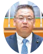
自民党 木名瀬 訓光 議員 (野田市)