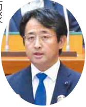
公明党 仲村 秀明 議員 (船橋市)