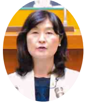
千葉民 入江 晶子 議員 (佐倉市・印旛郡酒々井町)