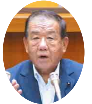
自民党 伊藤 和男 議員 (香取市・香取郡神崎町・香取郡多古町)