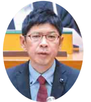
自民党 岩井 泰憲 議員 (印西市・印旛郡栄町)