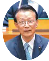
平和党 西尾 憲一 議員 (船橋市)