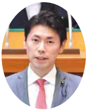
自民党 川名 康介 議員 (鴨川市・南房総市・安房郡)