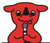
千葉県マスコットキャラクター

https://www.chiba-ep-bis.supercals.jp/webportalPublic/LPS1P30R.html