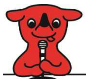
千葉県マスコットキャラクター

法定福利費を適正に負担する企業による公平で健全な競争環境の構築の推進のため、建設業者の皆様の一層の御協力をお願いします。