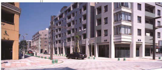
幕張ベイタウン〈美浜プロムナード〉