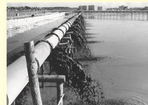
埋立土砂を運ぶ送泥管 Mud pipe that carries landfill sediment