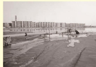
埋立風景 Landscape of landfill