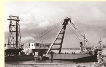
海底の土砂をすくい取る浚渫船 Dredger to scoop up the earth and sand on the seabed