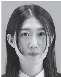
髪が黒目にかかっているもの