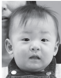
補助者の体の一部が写り込んでいるもの