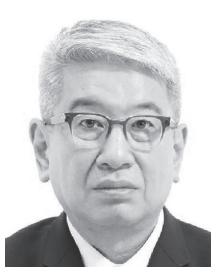
人物と背景の境界が不明瞭なもの