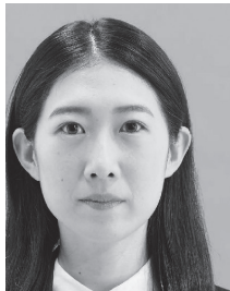
位置が偏り余白が足りないもの