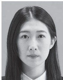
顔の輪郭が隠れるもの