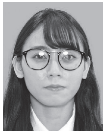
照明の反射により黒目が確認できないもの