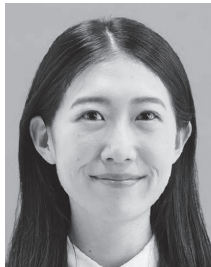
平常の顔貌と著しく異なるもの（笑いすぎなど）