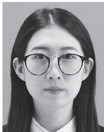
眼鏡のフレームが黒目にかかっているもの