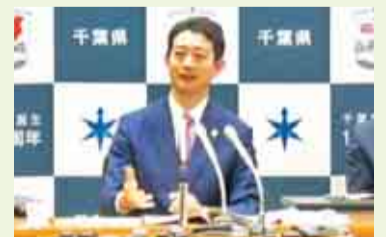
当初予算案発表の定例記者会見 (1月31日)

千葉県庁 代表電話 043-223-2110 ホームページ https://www.pref.chiba.lg.jp 編集・発行/千葉県総合企画部報道広報課 〒260-8667 千葉市中央区市場町1番1号 TEL 043-223-2241 FAX 043-227-0146