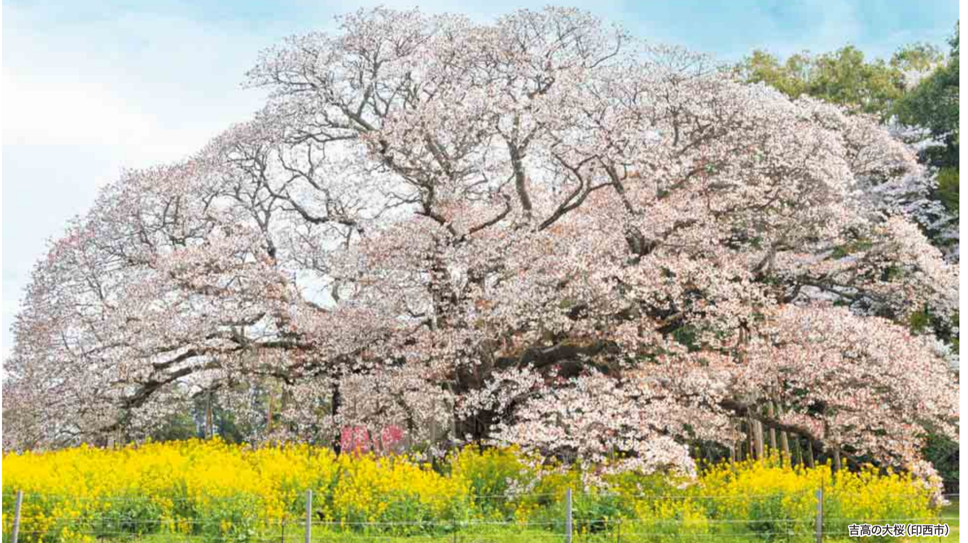
吉高の大桜(印西市)