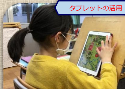
タブレットの活用