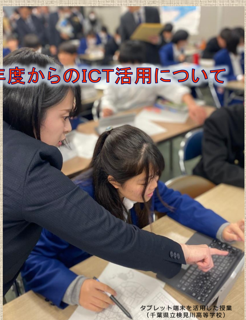
タブレット端末を活用した授業 (千葉県立検見川高等学校)

『特別支援学校のBYODの導入については、障害の状態等に応じて対応します。』 詳細については、学校にお問い合わせください。』