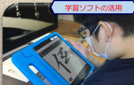
学習ソフトの活用