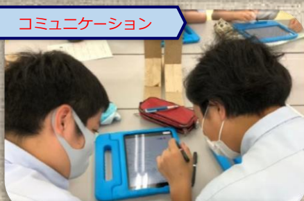
コミュニケーション