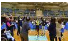
シーソー玉入れ、他2競技