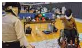
車いすフェンシング