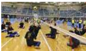
シッティングバレーボール