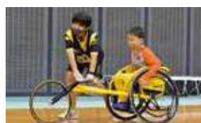
陸上競技(レーサー体験)