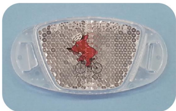
自転車の側面(スポーク)につける反射器材の例

光学的に特別な加工がされており、車のヘッドライトなどの光が当たると、強い光を運転手の方向に返すようになっています。自転車の後ろに装着する反射器材(リフレクタ)は、自転車の後方100mから車のヘッドライト(ハイビーム)で照らし、容易に確認できる性能を備えています。