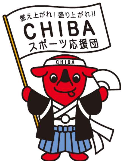
千葉県PRマスコットキャラクターチーバくん

※デザインを使用する場合には、必ず「千葉県PRマスコットキャラクターチーバくん（英文：Chiba Prefecture Mascot CHI-BA+KUN）」標記を付すこと。