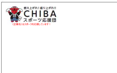
名刺 / 55×90mm

※「燃え上がれ! 盛り上げれ!! CHIBAスポーツ応援団」が読み取れるサイズとしてください