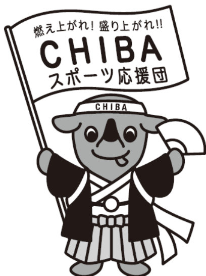
千葉県PRマスコットキャラクターチーバくん

※但し、使用サイズに応じて「チーバくん」（英文：CHI-BA+KUN)のみでも可とする。