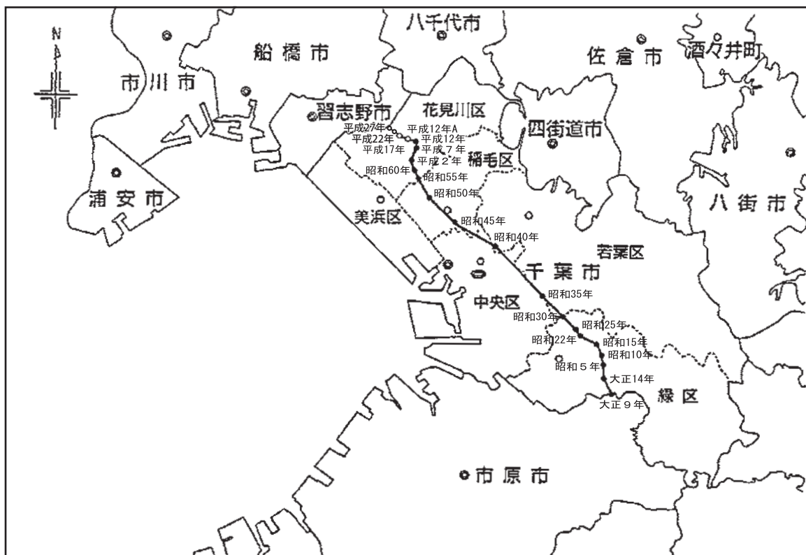
人口重心の移動（大正9年～平成27年）